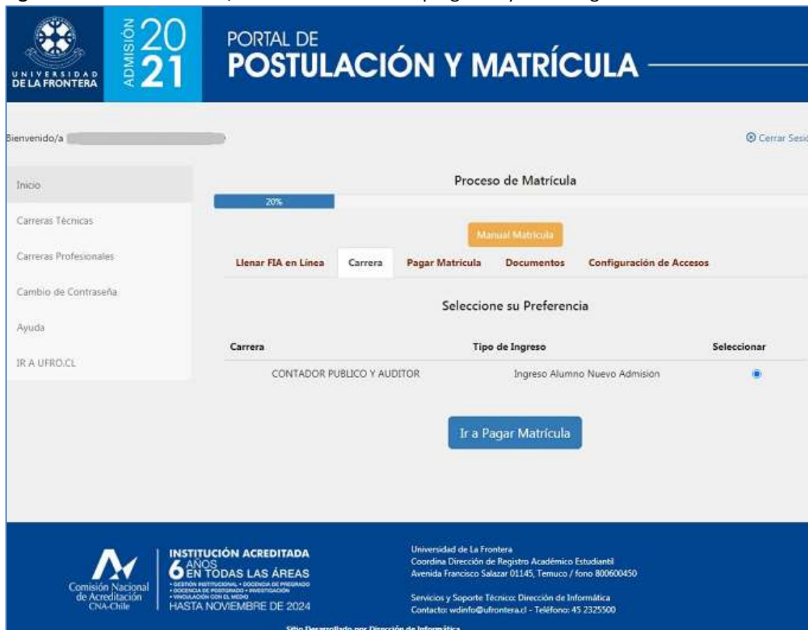
Figura 2: Matrícula –Paso 2, selección de carrera o programa y vía de ingreso

El siguiente paso es el pago del arancel de inscripción, como se muestra en la figura 3. Para algunos procesos de matrícula es probable que se pueda también pagar algún otro servicio. En la pantalla del ejemplo es posible pagar opcionalmente la Tarjeta Nacional Estudiantil (TNE), a utilizarse en el transporte público.