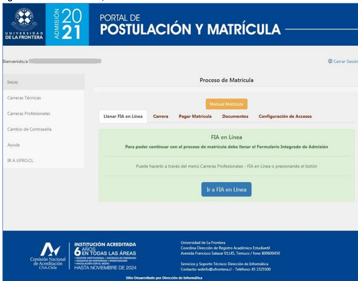
Figura 1: Matrícula – Paso 1, llenado del FIA en línea

La matrícula es un proceso en cinco etapas o pasos secuenciales, como se puede ver en la figura 1. El primer requisito para matricularse es haber llenado previamente el FIA en línea. Si no se ha llenado es posible acceder directamente desde esta página.