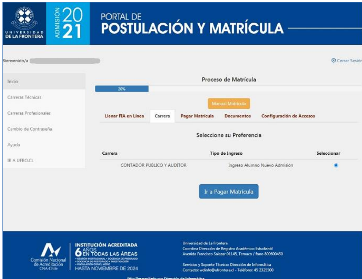
Figura 2: Matrícula –Paso 2, selección de carrera o programa y vía de ingreso

El siguiente paso es el pago del arancel de inscripción, como se muestra en la figura 3. Para algunos procesos de matrícula es probable que se pueda también pagar algún otro servicio. En la pantalla del ejemplo es posible pagar opcionalmente la Tarjeta Nacional Estudiantil (TNE), a utilizarse en el transporte público.