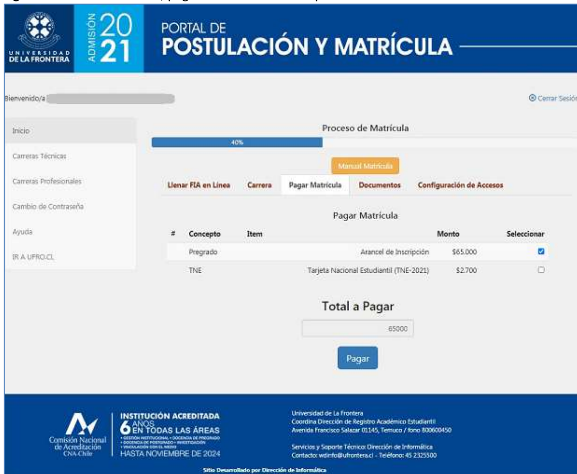
Figura 3: Matrícula –Paso 3, pago del arancel de inscripción

Al presionar el botón “Pagar” se abrirá una nueva ventana del servicio Webpay Plus, para realizar el pago electrónico con tarjetas de crédito o débito de diversos emisores de tarjetas en el país. Una vez realizado el pago se volverá a la página del portal de matrícula. Si los datos no se refrescan por sí solos, se deberá presionar el botón “Actualizar datos para ir al paso siguiente.