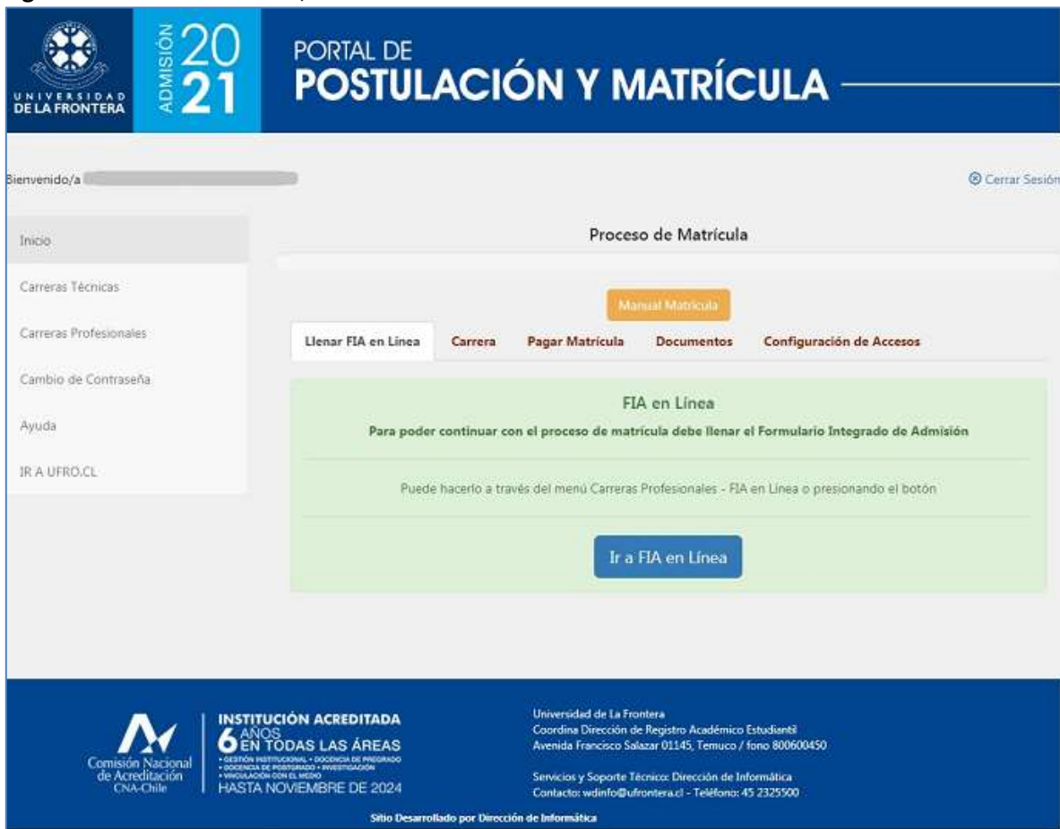
Figura 1: Matrícula – Paso 1, llenado del FIA en línea

La matrícula es un proceso en cinco etapas o pasos secuenciales, como se puede ver en la figura 1. El primer requisito para matricularse es haber llenado previamente el FIA en línea. Si no se ha llenado es posible acceder directamente desde esta página.