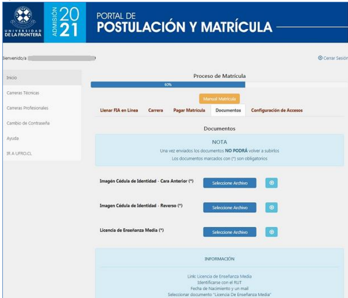
Figura 4: Matrícula –Paso 4, subida de documentos

A continuación, será necesario subir al sistema los documentos electrónicos requeridos para la matrícula, como se muestra en la figura 4. Cada convocatoria puede requerir documentos diferentes. Una vez ingresados todos los documentos será posible ir al paso siguiente.