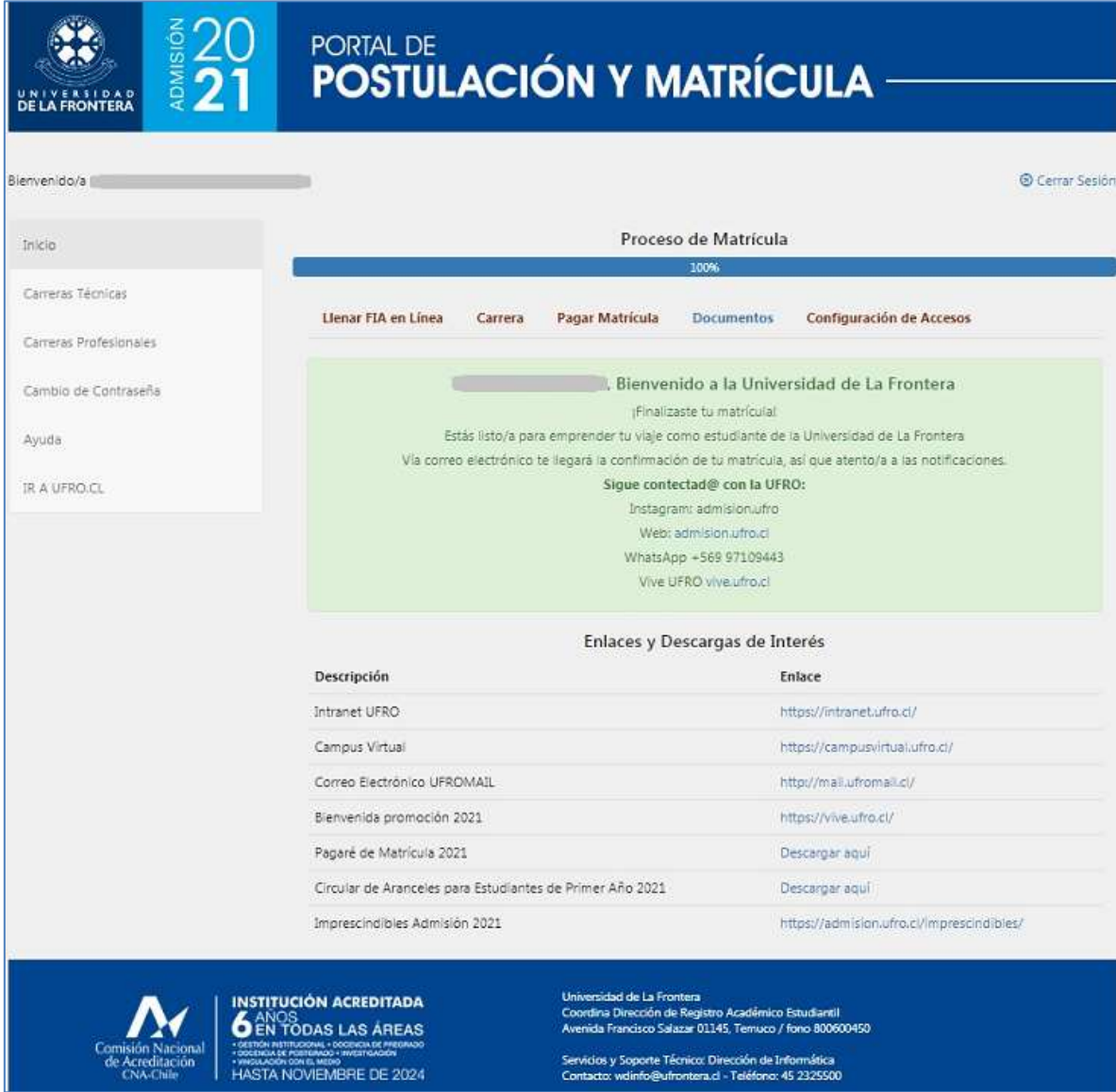
Figura 6: Matrícula – Bienvenida y enlaces de interés

Finalmente, aparecerá la pantalla de bienvenida, que se puede ver en la figura 6, con información y enlaces para continuar con la inserción a la Universidad.